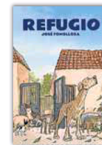
'REFUGIO' JOSÉ FONOLLOSA 96 páginas. 16 euros. Grafito.

La dureza de la realidad en Colombia motiva esta obra que promueve la Comisión de la Verdad, nacida tras el Acuerdo de Paz y basada en los miles de testimonios recogidos con el fin de visibilizar la problemática y esclarecer los dramáticos hechos del conflicto armado más largo de Latinoamérica. De Isusi escenifica diversos casos, mostrando retazos de vida de un cúmulo de personajes exiliados por circunstancias muy dispares pero todas aciagas, entrelazados por relaciones sociales, personales, políticas o laborales. Se trata de reparar la injusticia pero también de reivindicar la memoria y la pérdida.