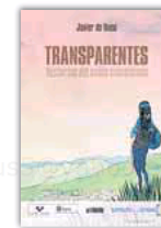
'TRANSPARENTES' JAVIER DE ISUSI 136 páginas. 16 euros. Astiberri.

que sufren innumerables ciudadanos colombianos dentro y fuera de su país. El desgarrador social y la pérdida de vidas generados por el conflicto armado es el objeto argumental de 'Transparentes', la novela gráfica de Javier de Isusi que da voz a innumerables testigos en el exilio. El último Premio Nacional de Cómic firma una obra valiosa y necesaria, cargada de sentimientos, que nace como un encargo de la Comisión de la Verdad de Colombia. Finalmente, y como complemento a la desgracia humana que se cierne sobre muchos ámbitos, la vida animal tampoco está exenta de calamidades. Así lo demuestra 'Refugio', un álbum de José Fonollosa que desglosa con humor y verismo la problemática derivada del abandono de las mascotas caninas. El libro aporta mucha información y contribuye a concienciar sobre una circunstancia quizá menos relevante que la injusticia sufrida por el hombre pero a la postre derivada de su propio comportamiento. Durante el mes de febrero en la web de Grafito Editorial se está realizando una preventa que incluye diversos regalos y recompensas.