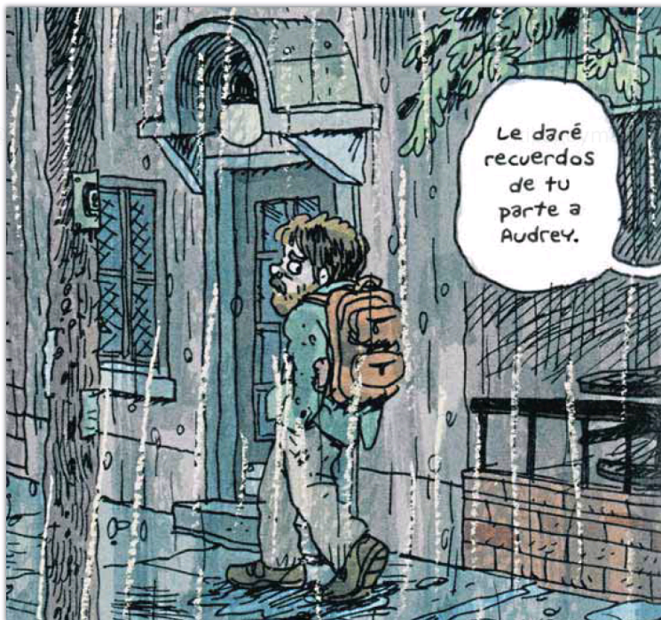
Fante Bukowsky es un aspirante a escritor mediocre pero persistente.

Continúan las aventuras urbanas de este perdedor cuya mediocridad apabullante le otorga una extraña pátina de genialidad. Dispuesto a escribir la gran novela americana en una pensión de mala muerte, intenta introducirse en el mundo literario por todos los medios, algunos vergonzantes, para terminar publicando un fanzine y venderlo sin éxito. Furioso con el universo que ignora su genialidad, resulta patético pero entrañable mientras protagoniza una aventura vital tragicómica marcada por el fracaso y repleta de personajes pintorescos, en la que reaparece una antigua amante que logra el éxito como escritora.